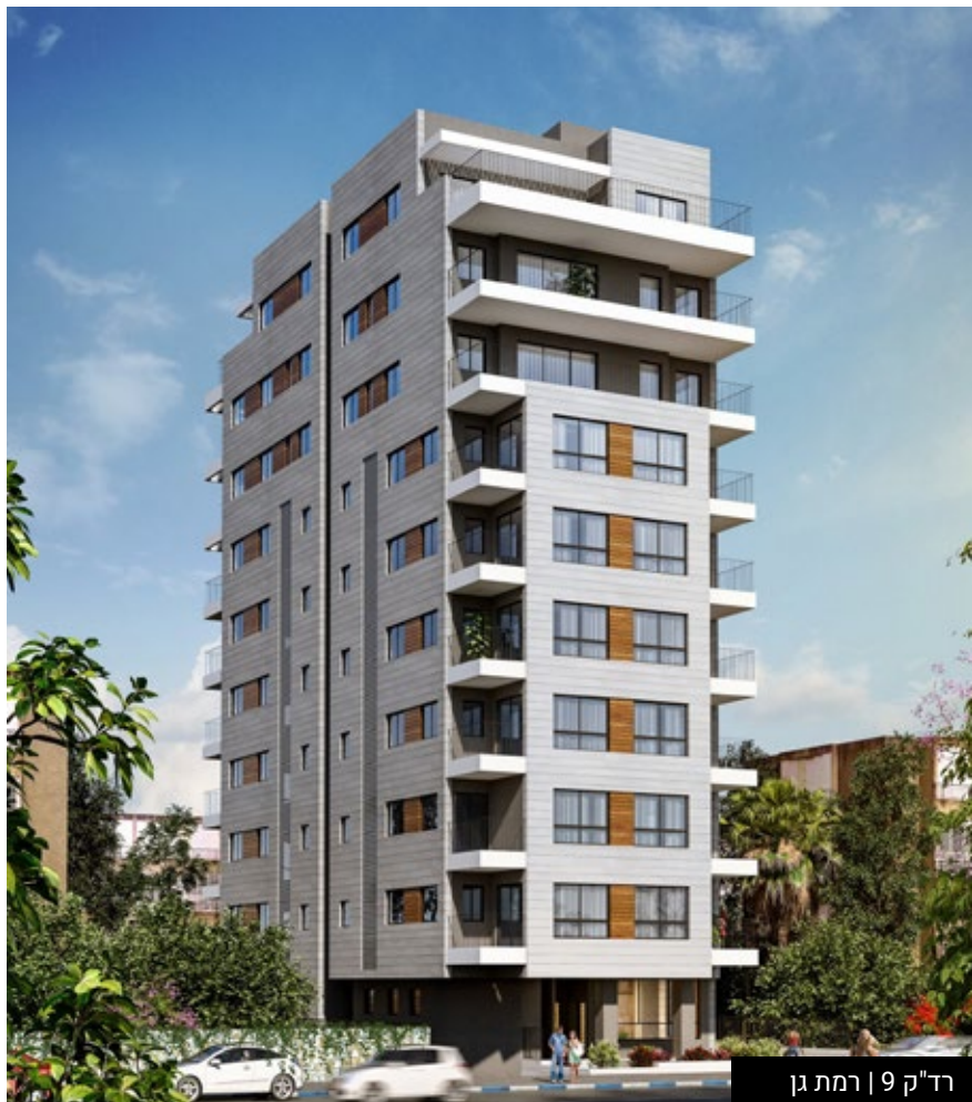
רד"ק 9 | רמת גן