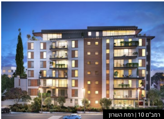
רמב"ם 10 | רמת השרון