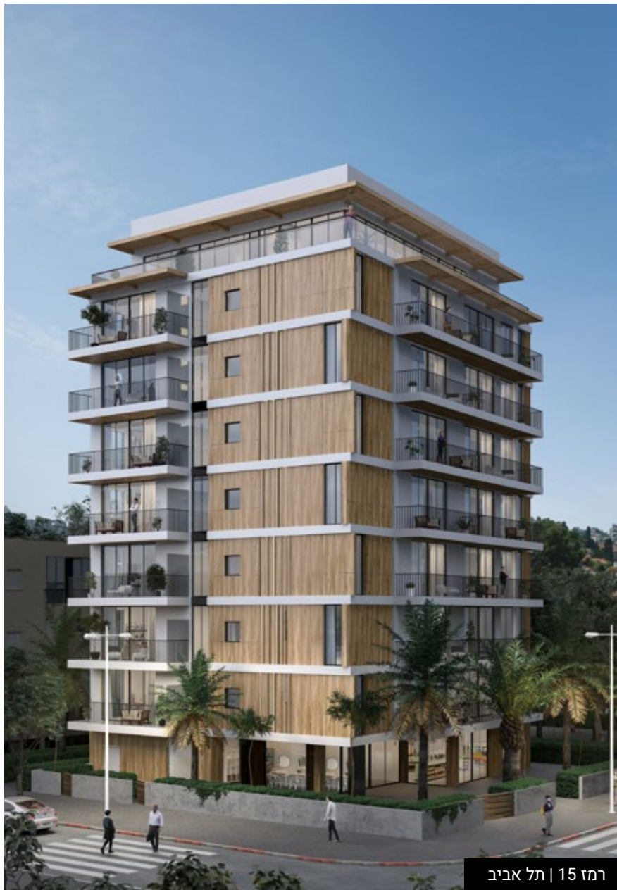
רמז 15 | תל אביב