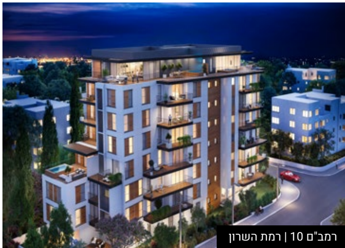
רמב"ם 10 | רמת השרון