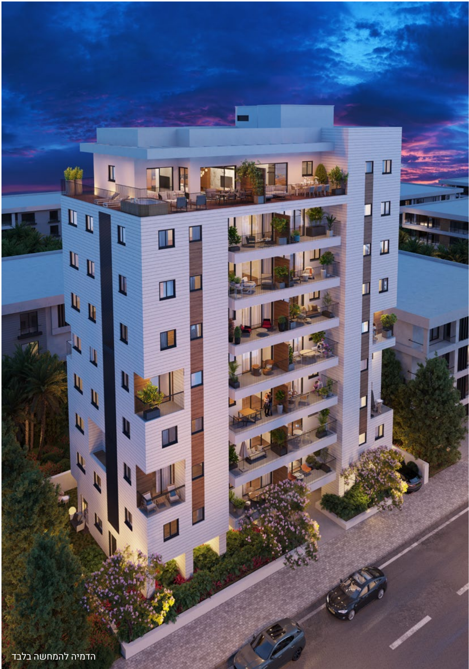
הדמיה להמחשה בלבד