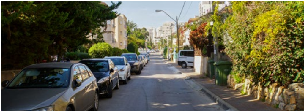
השר משה | רחוב אינטימי ושקט

מערבה נמצא רחוב בן גוריון, והלאה לקניון, קאנטרי ופארק גבעתיים ורחוב ערבי נחל וכיוון תל אביב. תוכלו להיות בטוחים כי אתם במרחק דקות הליכה או נסיעה ממרכז קניות, פארק גדול, עירייה, בנקים, קופת חולים, תיכון או בית ספר ואפילו גני ילדים עבור המשפחות הצעירות.