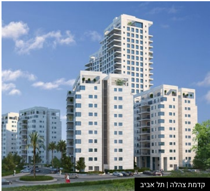
קדמת צהלה | תל אביב