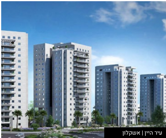
עיר היין | אשקלון